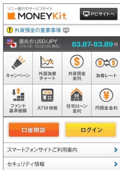
「口座開設」ボタンを設置したトップページ