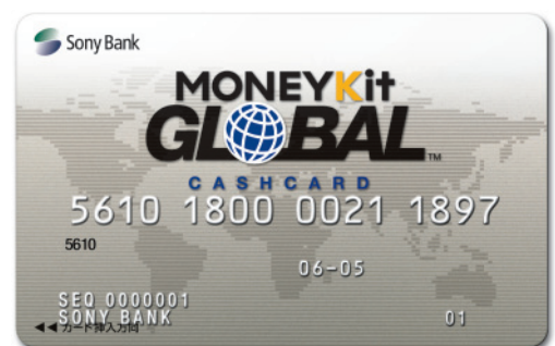
▲ MONEYKit グローバル・キャッシュカード