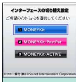
<Edyチャージアプリトップ>

ソニーバンク提供のEdyチャージアプリでは、「MONEYKit」、「MONEYKit-PostPet」、「MONEYKit-ACTIVE」の3つのインターフェイスからお好きな画面を選択できます。