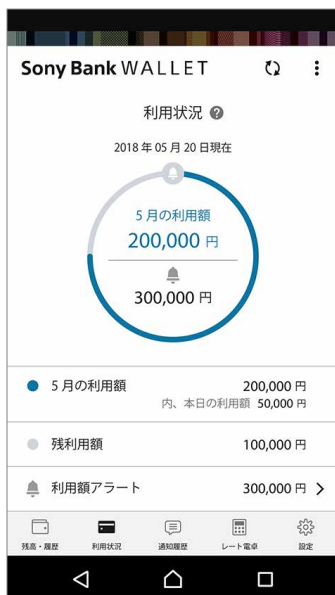
< 利用状況画面 >