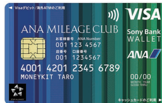
ANAマイレージクラブ / Sony Bank WALLEET

今後、100万枚達成を記念したキャンペーンを実施する予定です。詳細が決まり次第、ご案内いたします。