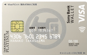
タカシマプラチナデビットカード